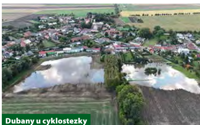
Dubany u cyklostezky