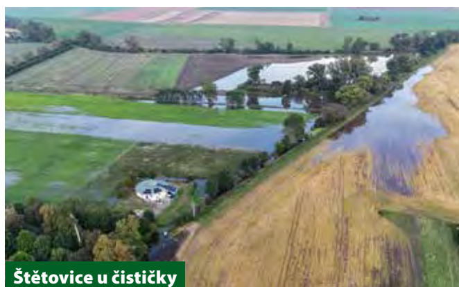
Štětovice u čističky