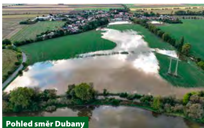
Pohled směr Dubany