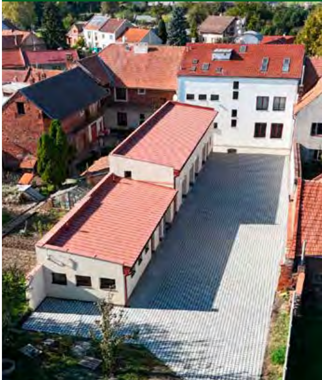
Dlažba k zázemí za obecním úřadem ve Vrbátkách