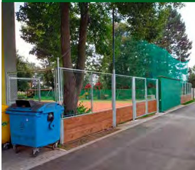
Rekonstrukce oplocení a brány na hřišti za sokolovnou v Dubanech