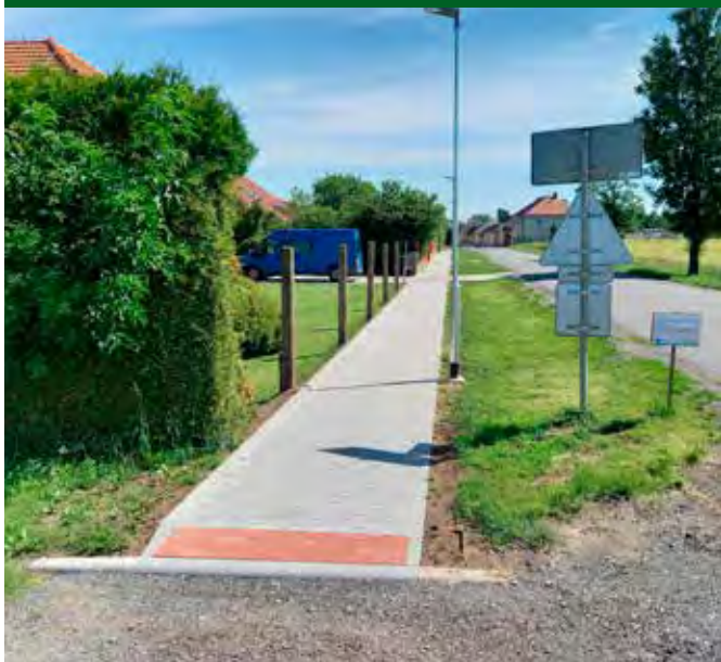
Chodník ve Vrbátkách – od stopky směr Prostějov