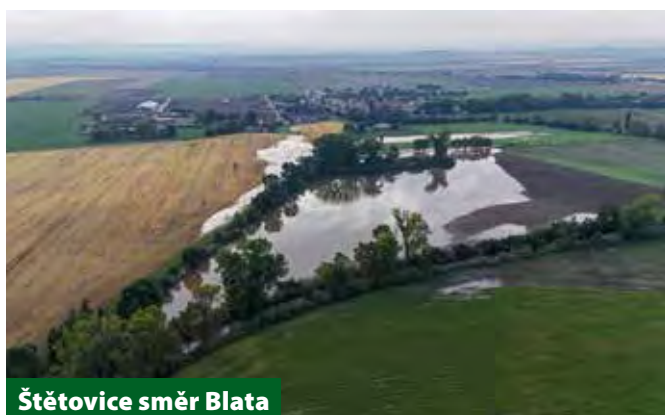
Štětovice směr Blata