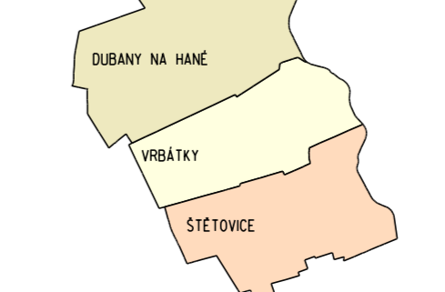
PŘEHLED KATASTRÁLNÍCH ÚZEMÍ